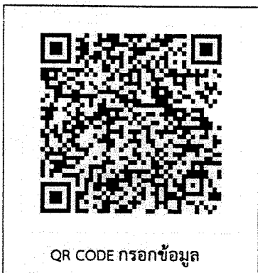
QR CODE กรอกข้อมูล