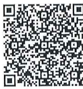
ตัวอย่างเอกสารการคัดเลือก อถล.