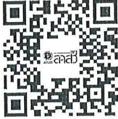
ระบบบัตรประจำตัวพนักงานเจ้าหน้าที่