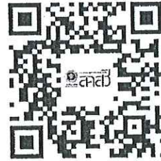
หลักสูตรความรู้พระราชบัญญัติสุขภาพจิตฯ