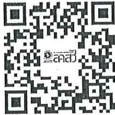
ระเบียบและประกาศที่เกี่ยวข้อง