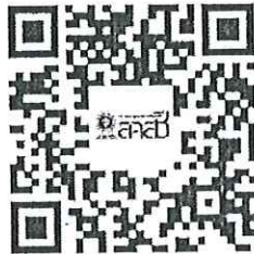
แบบฟอร์มที่เกี่ยวข้อง