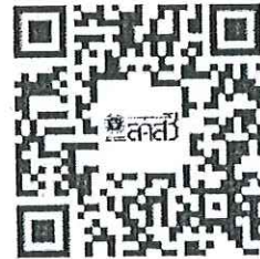
คำอธิบายและขั้นตอนการออกบัตรประจำตัว พนักงานเจ้าหน้าที่