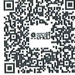
คู่มือการใช้ระบบบัตรประจำตัวพนักงานเจ้าหน้าที่