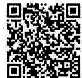
สิ่งที่ส่งมาด้วย

สำนักบริหารการคลังและรายได้ ส่วนการเงิน โทรศัพท์ ๐ ๒๒๗๑ ๘๘๔๕ ไปรษณีย์อิเล็กทรอนิกส์ : Finance๑๗@dlt.mail.go.th