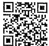
QR code ตอบแบบสอบถาม

สำนักงาน ก.ค. กลุ่มงานกฎหมาย โทร. ๐ ๒๒๒๑ ๘๑๙๗ โทรสาร. ๐ ๒๒๒๒ ๔๑๒๙